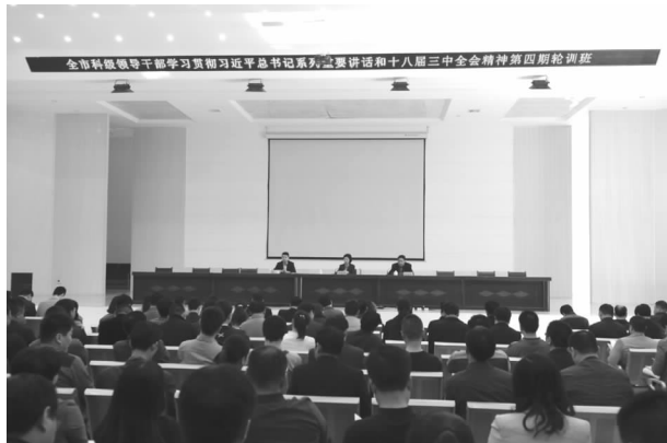
习近平总书记系列重要讲话和十八届三中全会精神集中轮训班

【干部培训】 先后举办了全市科级领导干部学习贯彻习近平总书记系列重要讲话和十八届三中全会精神集中轮训班4期，共培训科级干部962人次；举办了农村党组织书记培训班1期，共培训基层干部356人次。同时承办社会各界培训班49期，培训学员6700余人次。较为充分地发挥了干部教育阵地的功能作用，为市域经济社会的发展提供了优质的服务。