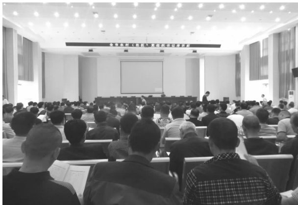
农村党组织书记培训班

讨、师资调配、教学评估”六统筹工作。优化教学、科研及各项管理工作，苦练内功，积极开展教学、培训进修等活动。积极参加了许昌市委党校组织的学术报告会和理论研讨会、“六统筹”教师授课等活动，并认真做好相关工作。全年共参加24场次学术报告会，其中我校教师作了3场学术报告。