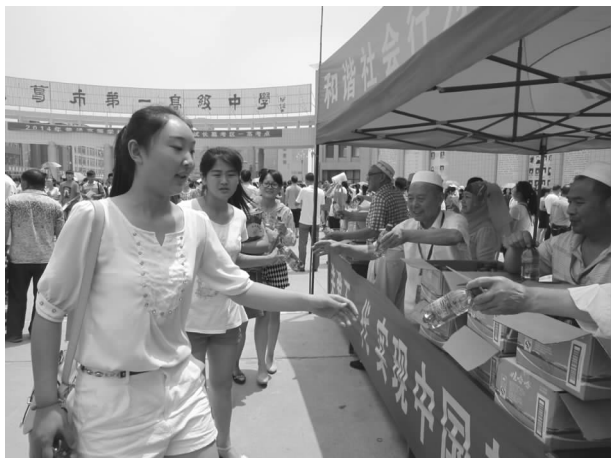
少数民族志愿者开展以“心连心，高考情”为主题的爱心送水服务活动

在宗教局和市伊斯兰教协会的倡导下，长葛市穆斯林群众已连续5年自发组织少数民族志愿者开展了以“心连心，高考情”为主题的爱心送水服务活动。30多名穆斯林志愿者发放矿泉水近400箱，受到考生和家长的一致好评，并得到了市委、市政府充分肯定。二是慰问部队官兵。八一前夕，穆斯林群众自发组织，带着羊肉、西瓜、矿泉水等慰问品，看望正在苦练三伏的部队官兵，致以节日的问候和崇高的敬意，进一步提升了少数民族形象，为全市民族团结、社会和谐稳定奠定了良好基础。三是文明清扫行动。在长葛文明城市创建中，少数民族群众自发组织，通过打扫街道、维持交通秩序等活动，为全市城市文明创建工作做出贡献。