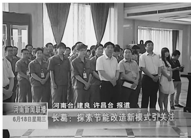
河南省电视台对长葛节能签约仪式进行报道

入推进，共实现节约用水、电、油等费用支出109.63万元，比去年下降4.2%，超额完成了节能目标任务。二是东区综合办公大楼被评为“河南省公共机构节能示范单位”，为全市公共机构节能工作做出了表率。三是促成了森源集团与长葛市政府以合同能源管理的模式，签订了全市路灯的LED节能改造项目合同。该项目的成功签约，不仅成为河南省第一个运用合同能源管理模式对城区路灯进行整体节能改造的项目，更实现了不用政府投资一分钱，就可以完成城区6千多盏路灯的节能改造，每年节约电费400多万元的极大的社会效益。