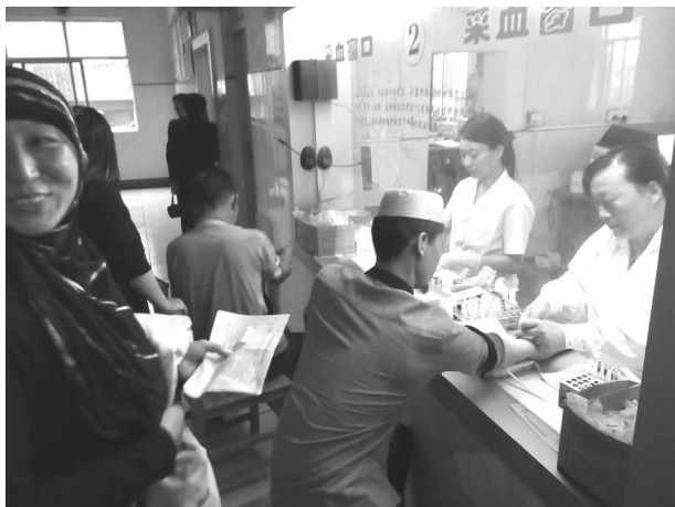
民族宗教界代表人士在中医院进行免费健康体检

管会主任、阿訇及宗教界代表人士学习有关政策法规，通报各项工作进展情况，听取大家对工作的意见和建议，着力解决实际问题。二是组织民族宗教界代表人士116人进行了免费健康体检，并建立电子档案。三是每逢开斋节、圣诞节、春节等重大节日，四大家领导对民族宗教界人士进行看望慰问。四是斋月里，对教职人员及贫困户进行探视慰问。五是20名宗教教职人员发放生活补贴，每人年补贴3600元，充分体现了党和政府对少数民族和信教群众的关心和爱护。