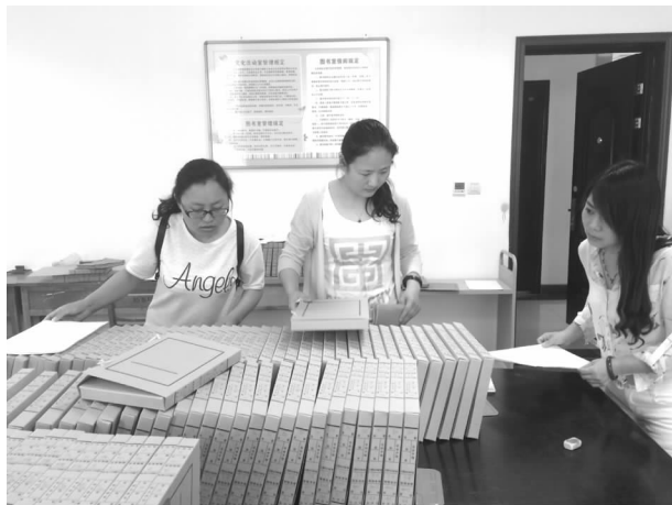
开展全市各单位档案接收整理工作

【归档文件整理】 切实抓好各立档单位文件材料归档指导工作，不断提高档案管理的整体水平。共整理档案资料 17232 件（册），其中永久 3996 件，定期 10 年 12310 件，资料（含合订本）926 卷（册）。输入档案条目 13629 条（已全部刻入光盘并交至档案馆）。