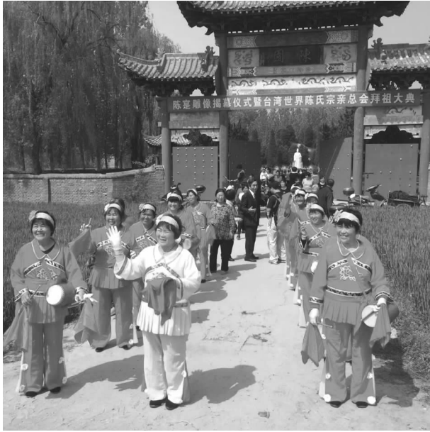
陈寔雕像揭幕仪式暨“台湾世界陈氏宗亲总会”拜祖大典

中，经济上有实力、政治上有地位、社会上有影响、学术上有造诣的海外华侨华人 10 余人，与全球多个国家和地区的华侨华人及其社团保持着密切联系。