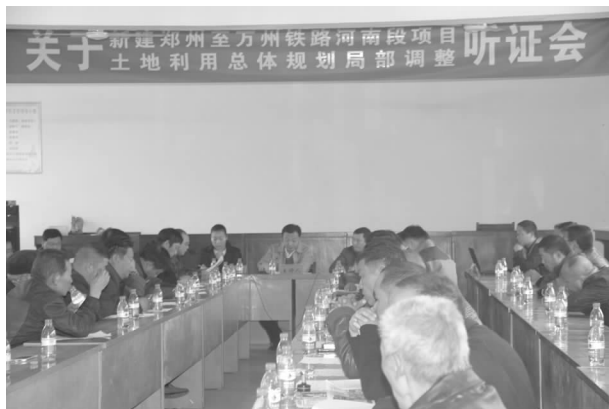
新建郑州至万州铁路河南段项目土地利用总体规划局部调整听证会

【房地产市场发展】 2014 年全市房地产开发投资 22.46 亿元，商品房在建项目 49 个，在建工程面积 198.07 万平方米，新开工面积 38.37 万平方米，竣工面积 56.6 万平方米；销售商品房 4410 套，销