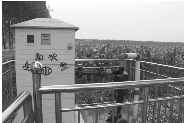
高效节水灌溉项目控制阀

重点项目已全部进入实施阶段，其中已完成 1 个，正在建设 6 个，正在筹备建设的 2 个。特别是节水