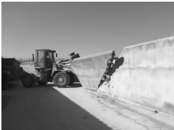
拆除违法占地建筑

【土地整理项目】 古桥、坡胡两个乡镇土地整理项目通过许昌市财政局、许昌市国土局验收合格。项目总规模 457.28 公顷，投资 708.98 万元，新增