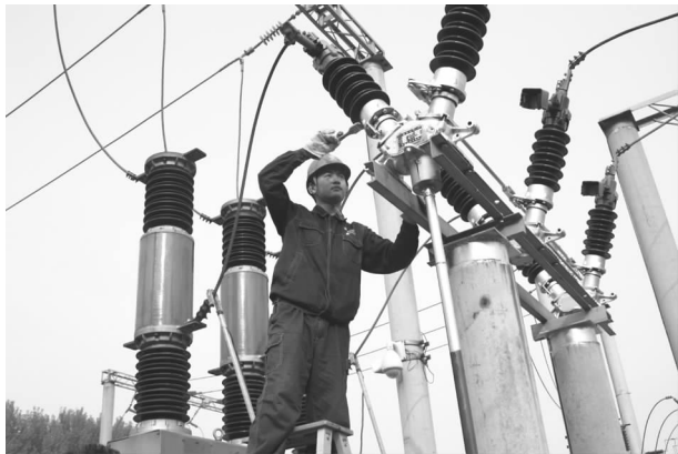
电力人员高空作业

安全生产稳定局面，不断完善应急响应机制，进一步细化各类应急预案，组织开展好应急演练，提升应急反应和应急处置能力。加强抢修队伍建设，保障抢修工具、物资、车辆配备到位，确保快速高效回复故障客户供电。统筹抓好信息、交通、消防等专业领域安全管理力度，确保安全生产局面稳定。开展安全月、安全日活动，切实增强全员安全意识。开展春、秋季安全大检查、安全生产大检查、调度通信大楼供电和消防专项安全检查等多项隐患排查治理工作等多项隐患排查治理工作，增加隐患排查次数和监督整改力度。截至12月31日，公司连续安全生产5905天，保持了公司长周期安全生产的良好局面。全年无火灾、人身伤亡、重大设备事故案件发生。