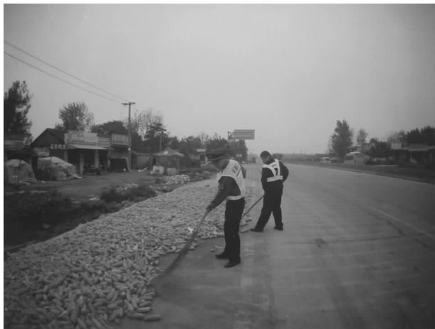
执法人员清扫道路晒粮

包”管理模式，把清理占道经营、店外经营、马路市场、非机动车乱停乱放等作为深入开展精细化管理工作的重点。特别是在重点部位、重点路段加强力量，严防死守，王庄早集马路市场治理、建设路夜市摊点治理、四二路水果市场治理、新区科技广场治理等都取得了显著效果。