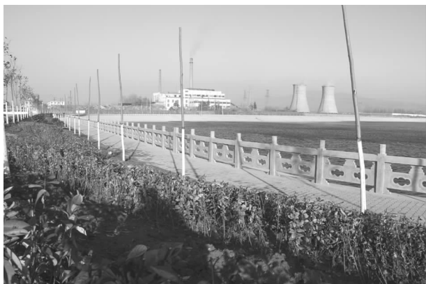
西部引水项目幸福湖改造工程

【西部乡镇引水灌溉】 投资5479万元的平禹一矿引水灌溉工程幸福湖调蓄池、河道治理、胜天湖与暖泉河节制闸建设已经完成，2014年已具备蓄