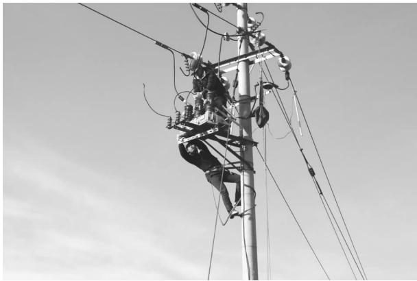
农网改造升级工程建设

10 千伏线路 51.27 千米、400 伏线路长度 58.9 千米、配电台区 68 座，新增配电容量 13.06 兆伏安。完成高标准粮田“万亩示范方”配电工程，总投资 528 万元，共计 63 个单项工程。