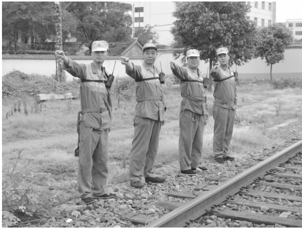
严格执行调车作业标准化

【安全生产】 一是强化基础管理，健全完善管理机制。按照《铁路中间站管理办法》及要求，完善以《站细》为主要内容的各项管理制度。并对车站管理人员进行优化，对各班组管理人员进行量化考核，制订出详细的量化考核指标和要求，对班组点名制度、业务学习制度、零星假制度、应急预案等进行了重新的梳理、推敲、修改，组织职工进行记名式传达学习，确保新的管理制度入脑入耳，从根本上加强劳动纪律和作业标准的落实，达到“以制度管人”的目的。二是找准安全关键点，超前控制防范。始终坚持强化现场作业控制，抓小防大，抓标准落实，抓行为控制，抓综合天窗施工，抓设备隐患整治，不断提高“坚持抓客车、非常抓行车、正常抓调车、日常抓人身”的安全意识，