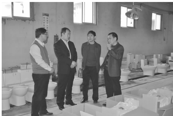
市领导考察卫浴品质

【产业提升】 继续做好卫生陶瓷产业品牌建设和市场推广工作；抓好建筑机械产业行业自律和企业转型工作；推动胶印版材产业升级改造工作。全年卫生陶瓷产业组织参展3次，参会3次，各类培训7期，5家企业荣登2014年度新锐榜，10家企业产品通过节水认证，4家企业与国内知名企业开始合作贴牌生产，2014年卫浴国抽合格率达到100%。建筑机械产业行业例会定期召开，成功组