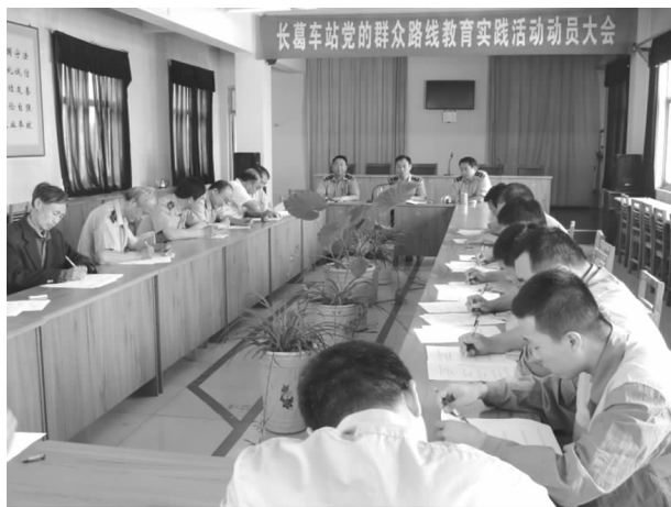
开展党的群众路线教育实践活动

【队伍建设】 长葛车站把主题教育活动与贯彻落实局、郑站“推进铁路科学发展、共建美好郑站家园”努力实现“郑站梦”系列活动部署结合起来，与深入开展“爱岗位、奔事业，创一流、建家园”主题宣传教育活动结合起来，与深化“创先争优”“争做一流中间”活动结合起来，与解决关系职工切身利益的突出问题结合起来，充分发挥党员干部的先锋模范带头作用和引领作用，并通过职工大会、点名会、交班会等形式加强职工的教育学习引导。通过深化“爱奔创建”主题活动，切实引导广大干部职工正确认识、准确把握美好郑站家园建设的新形势和新机遇，牢固树立知法守法、知恩感恩、爱岗敬业、争当先进的理念，为建设“安宁、文明、殷实、和谐”美好郑站家园和实现“郑站梦”、“郑站人梦”凝聚强大的合力、提供智力支持、营造积极向上的文化氛围，以此确保职工队伍稳定。