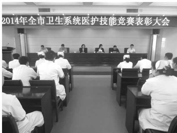
卫生系统医护技能竞赛表彰大会

了乡村医生的培训力度。联合市总工会，组织开展了医护技能竞赛活动，通过比赛，使广大医务人员积极学习专业技术知识，熟练掌握医疗操作技术，进一步提升了医疗技术水平。3、注重医院交流合作，着力提升医疗技术。市医院与郑大一附院建立了长期合作关系，医院业务骨干到郑大一附院挂职、培训，拓宽技术层面，郑大一附院的专家教授定期到市医院进行坐诊交流，着力提高县级医院的医疗技术。