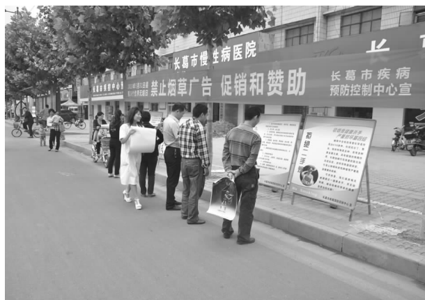
卫生科普知识宣传

【健康教育】 进一步提高和增强广大人民群众的健康意识,普及健康知识和技能,积极与本地多家媒体协作,开展了形式多样的宣传,加大了卫生知