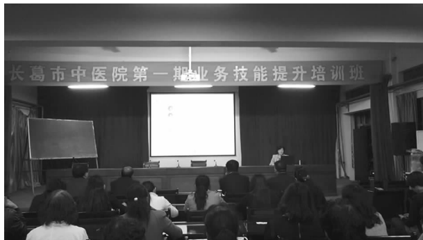
举行第一期业务技能提升培训班

在职职工 426 人，其中行管后勤 101 人，卫生技术 325 人（正高级职称 1 人、副高级职称 14 人、中级职称 81 人、初级职称 200 人、无职称 29 人），退休 86 人。