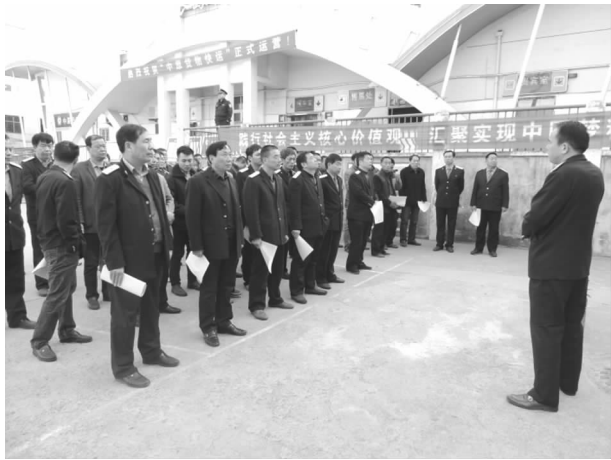
组织职工开展消防演练

车过程中，严格落实接发列车标准，突出客车、列车、正线。严把阶段计划的收、核、纠、抹、办及占线板的填记，从标准上落实，在细节上卡死。在调车作业中重点抓调标和调车联控的落实以及切割正线的调车作业等关键环节，针对站内线路、坡道等关键点，卡死调车关键，坚持调车组现场交接，认真掌握站存车位置、状态，严格调车作业“三坚持、三不准”制度，对切割正线的调车作业坚持干部上岗监护，没有监护不准作业。三是强化日常学习演练，提高应急应变能力。以常见故障为处理重点。强化非常行车模拟演练，提高职工的应急应变能力。并针对车站所存在的问题建立问题库，及时分析整改，同时制定有针对性的防范措施。以此提升车站、班组、职工应对突发事件的能力。进一步夯实车站的安全基础工作。