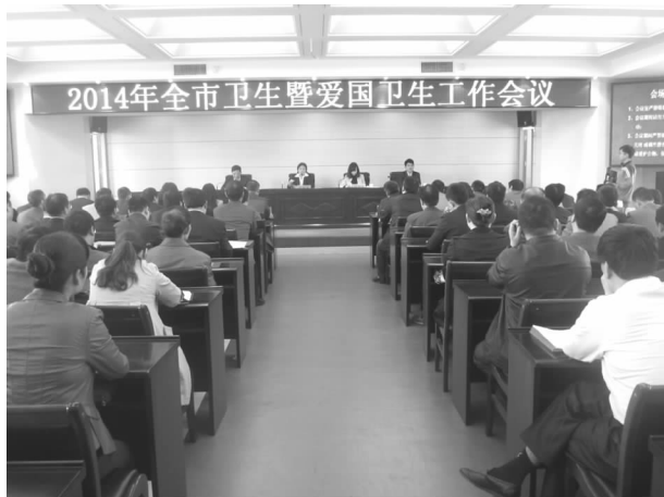
爱国卫生工作会议

善。以实施“120”急救指挥中心建设项目为契机，进一步完善了全市卫生应急和院前急救网络，科学储备物资，落实工作机制和预案，组织开展了业务培训和应急演练，不断提高医疗卫生应急队伍的应急处置能力。