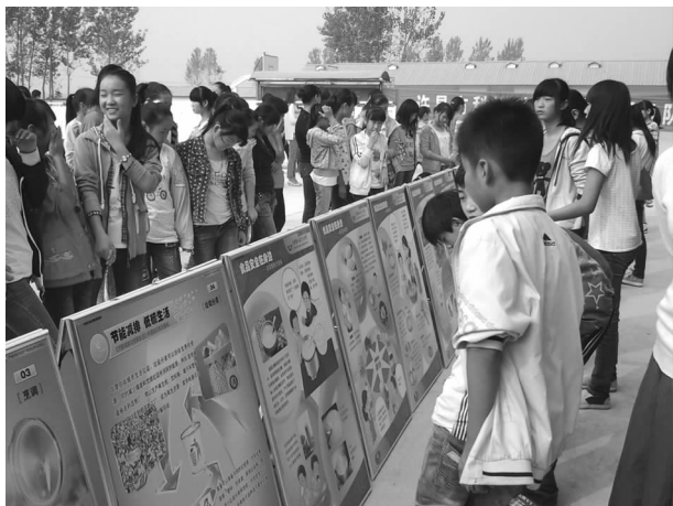
“科学体验”进乡村学校少年宫

加强城镇劳动者各项科学素质水平的提升。劳动部门充分发挥全市培训中心和职业技能鉴定中心的职能作用，积极为社会培训各类实用人才，努力提高劳动者素质和就业技能，培训企业职工25000人，农村劳动力1万余人，下岗失业人员4000人，妇女5000余人，困难职工2000余人。为有创业意愿的劳动者提供开业指导、开业测评、小额担保贷款、政策扶持及后续跟踪等“一条龙”服务，帮助能够成功创业，有效创业，在自身富起来的同时充分发挥以创业带动就业的倍增效应。