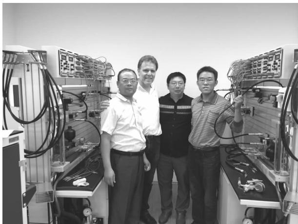
中德班教师在德国培训

【创办德国模式的考培中心】 在市委、市政府大力支持下,由省教育厅牵线,北京思威普智业投资有限公司搭桥,合作创办了“中德职业教育教学班及员工考培中心”,河南省教育厅批准我校开设机电一体化专业中德“双元制”教学班,学校选派了8名教师到德国培训,9月份组织学生面试,确定学生人选21名。同时由德国提供教学实训设备,建设理实一体化教室。旨在中国国内的员工或职校生经过在考培中心的培训及技能鉴定考试,获取国际认证的德国职业资格证书,可在德国就业或德资企业就业。